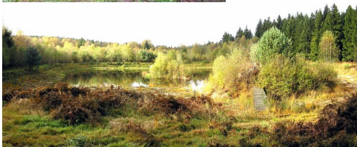
Forêt de Breuil-Chenue

En tout cas les forêts étaient belles et les couleurs d'automne étaient superbes.