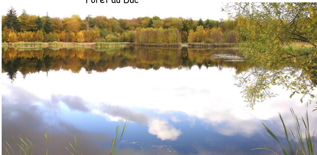
Forêt au Duc