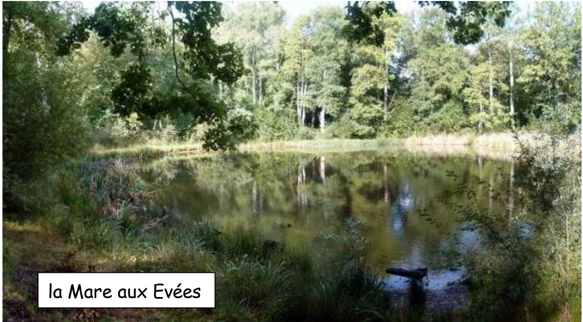
la Mare aux Evées

Pour cette sortie au carrefour de l'Épine foreuse (mare aux Evées), nous étions une trentaine (dont 9 SMF) à n'avoir pas cru Evelyne Dhéliat ou Nathalie Rihouet. Bien nous en a pris puisque la pluie n'est arrivée qu'à 17h soit 5mn après le départ et nous eûmes une journée très agréable.