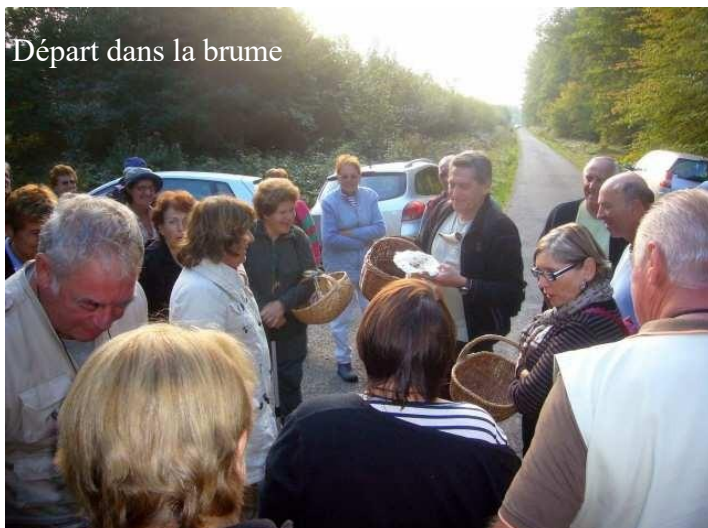
Départ dans la brume

Dimanche matin, nous avons prospecté en forêt de Réno-Valdieu ; certains ont fait le plein de trompettes des morts,