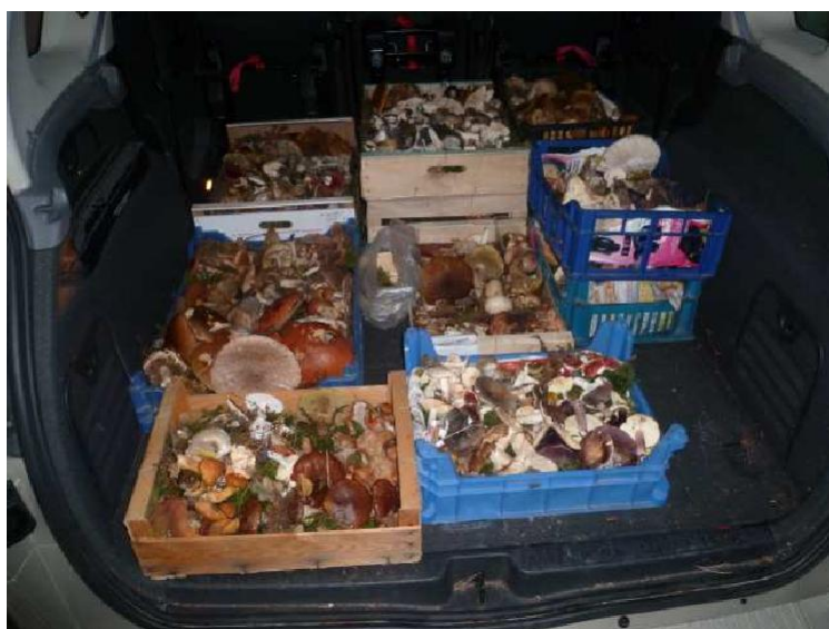
La récolte d'un des « cueilleurs »

Environ 400 visiteurs sont venus donc sensiblement moins que l'année dernière. La fréquentation serait-elle proportionnelle au nombre d'espèces présentées ? Il est vrai que quand ils trouvent des champignons, les promeneurs viennent nous les faire déterminer pendant l'exposition ce qui nous permet aussi de renouveler la fraîcheur des spécimens présentés. Cette fois, non seulement il n'y a pas eu de remplacement, mais la pluie des derniers jours a accéléré la dégradation de champignons déjà défraîchis. Vous pourrez constater plus loin que des hôtes indésirables se sont installés très tôt dans le week-end.