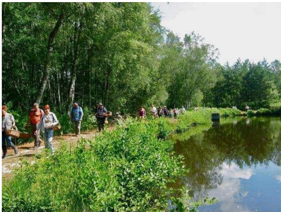
Le samedi matin en forêt de Lamotte-Beuvron

Nous étions 43 participants à arpenter les forêts solognotes. Le week-end était très agréable et, malgré le manque de champignons, comme d'habitude cette sortie a été très appréciée pour son cadre et son ambiance. Nous avons pu faire une petite exposition avec une trentaine d'espèces ce qui était suffisant pour initier les débutants sans les effrayer par une avalanche de noms barbares dont ils n'auraient rien retenu.