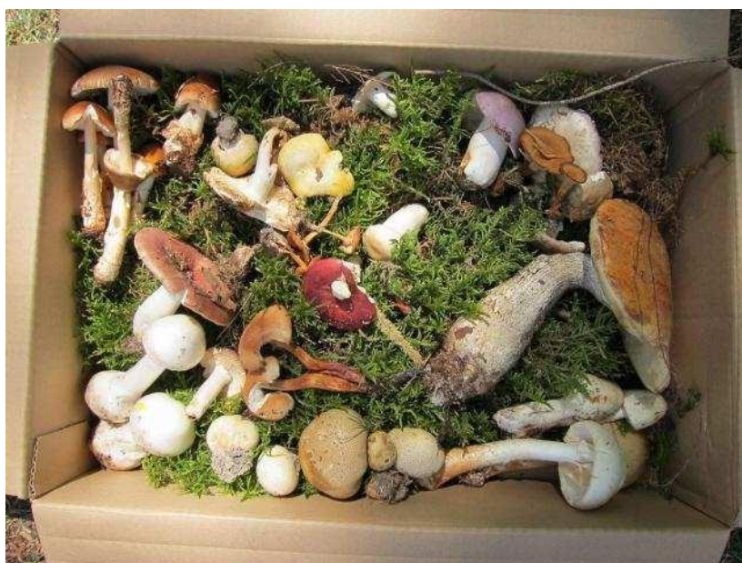
La cueillette du samedi matin